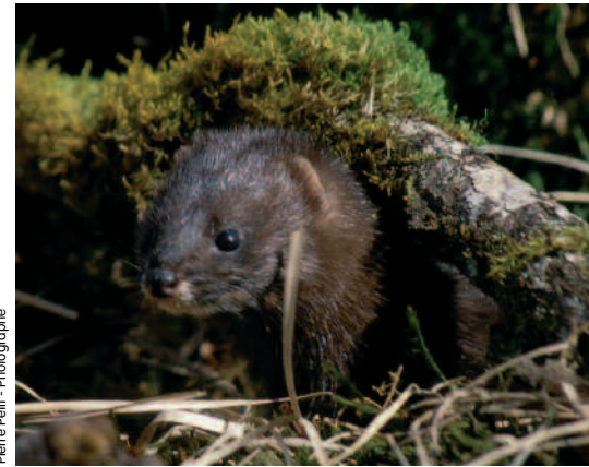
L'Aquitaine joue un rôle majeur dans la conservation des dernières populations de vison d'Europe.

... en faveur d'une faune et d'une flore rares et remarquables