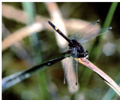
La Leucorhine à gros thorax, caractéristique des zones humides

Au terme du document d'objectifs, les partenaires du projet ont la possibilité de s'engager dans diverses actions liées au développement du site, dans le souci de sa sauvegarde et du maintien de son patrimoine. Une charte des pratiques de gestion courante et durable leur est proposée. D'autres initiatives sont prises dans le cadre de contrats de gestion dits Contrats Natura 2000 avec, actuellement, pour les zones agricoles, le Contrat d'Agriculture Durable (CAD). Des aides financières, parfois bonifiées, sont prévues dans ces contrats.