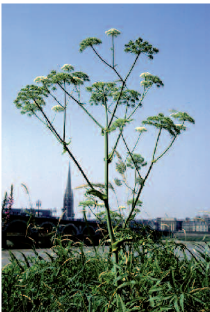
L'angélique de l'estuaire au cœur de Bordeaux

A partir d'un état des lieux, le document d'objectifs définit les enjeux et objectifs de gestion du site ainsi que les modalités fonctionnelles et financières de leur mise en œuvre. Préparé dans des groupes de travail, il est rédigé par un opérateur en concertation avec le comité de pilotage où les intérêts de chacun sont exprimés. La Loi sur le Développement des Territoires Ruraux de février 2005 renforce le rôle des collectivités territoriales dans le déroulement de cette concertation.