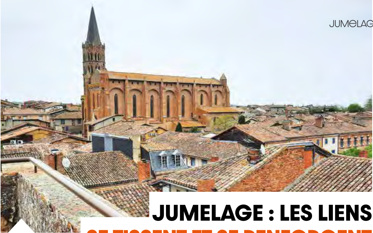
Beaumont de Lomagne.