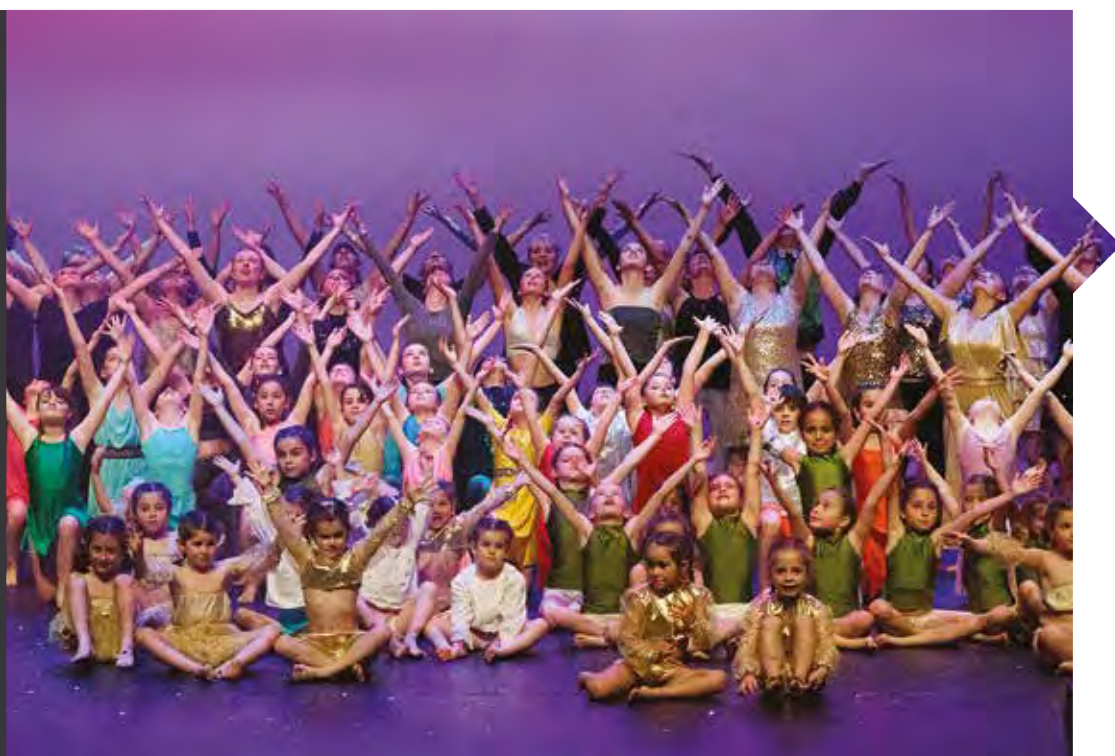
Gala de l'école de danse de Vayres à la Coupole de Saint-Loubès.